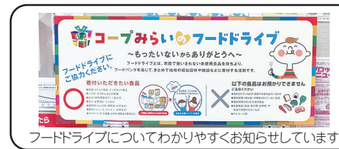
フードドライブについてわかりやすくお知らせしています