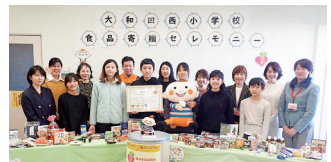
集まった54.5kgの食品と児童・関係者の皆さん

店舗の食品寄贈ボックスを見た児童からの発案で、大和田西小学校でフードドライブが取り組まれました。集まった食品はコープ八千代店に届けられ、フードバンクふなばしに寄贈されました。