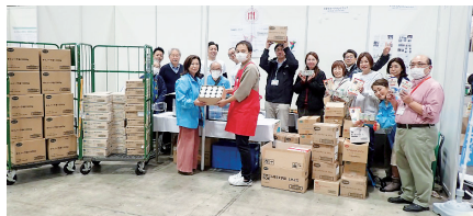
寄せられたたくさんの食品とフードバンクの皆さん

2月18日(日)に開催され、1万5千人の参加で賑わった「コープみらいフェスタきやっせ物産展」に、千葉県内のフードバンク8団体からなる「千葉県フードバンク団体連絡会」が参加して、フードドライブを実施しました。組合員や日本生協連などの取引先から495.3kgの食品が寄せられました。